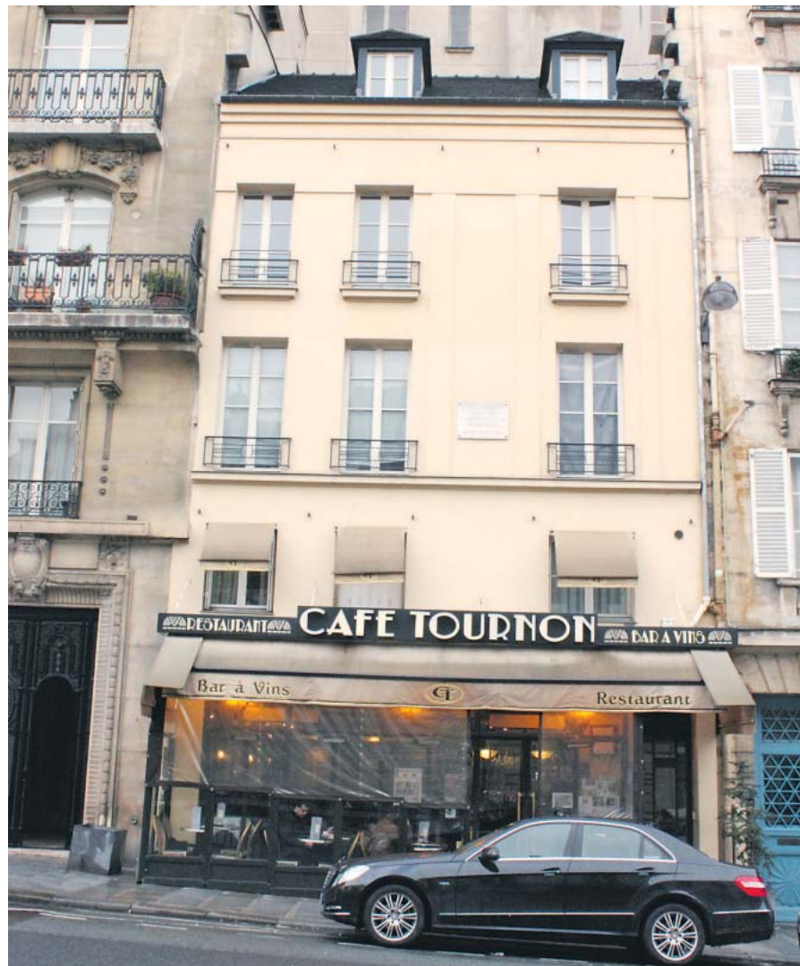
Joseph Roth hat hier getrunken, geraucht und geschrieben.

Café Tournon , 18 Rue de Tournon 75006 Paris, Telefon: 0033 / 1 / 43 26 16 16