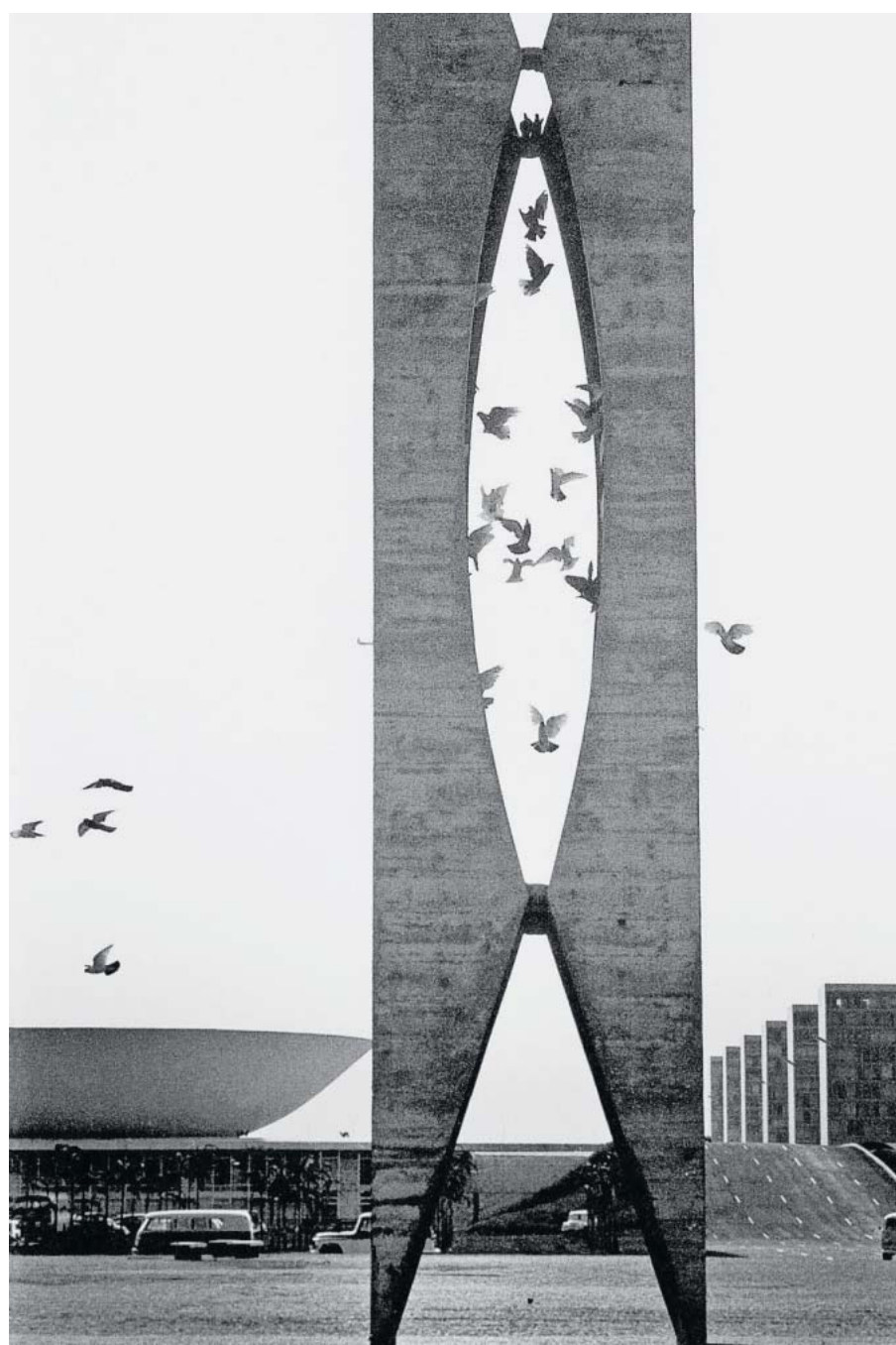
Wo ist das Vögelchen? „Haus der Tauben“ in Brasília.